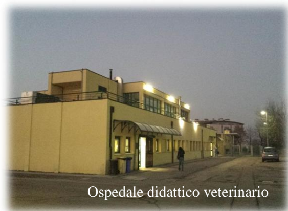
Ospedale didattico veterinario

Fakultet Veterinarske medicine, kao deo Univerziteta Bolonja, je smešten dvadesetak kilometara od same Bolonje u mestu Ozzano dell'Emilia. Fakultet raspolaže brojnim amfiteatrima-učionicama (18), vežbaonama, salama za patologiju i disekciju, jednom računarskom (informatičkom) učionicom koja je studentima na raspolaganju od 8-16 časova. U sklopu fakulteta se nalazi i Klinika (Ospedale Didattico Veterinario), na kojoj se pored