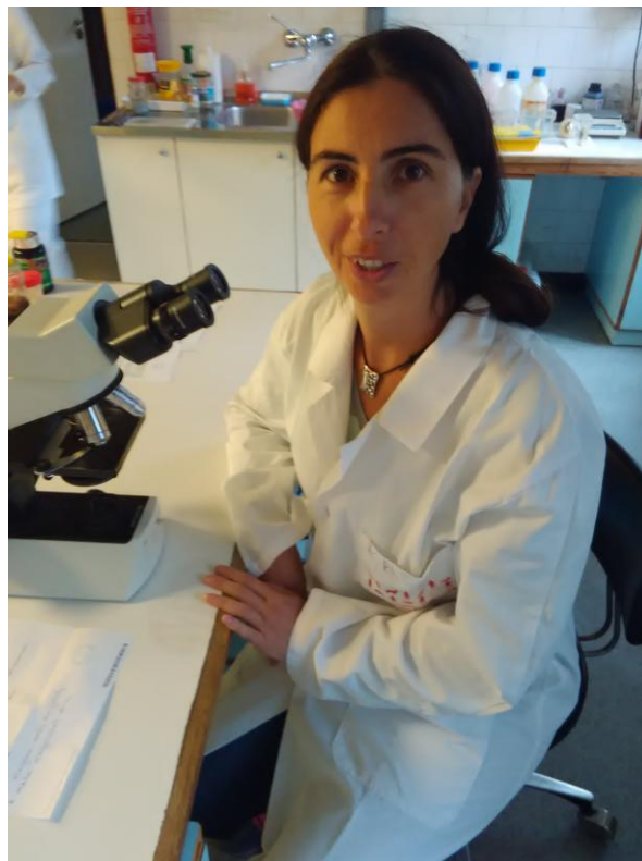
Slika 6. Rad u laboratoriji za patohistologiju

Tokom boravka stekla sam dragoceno iskustvo za unapređenje nastavnonaučnog rada na našem Departmanu, kao i lično profesionalno usavršavanje.