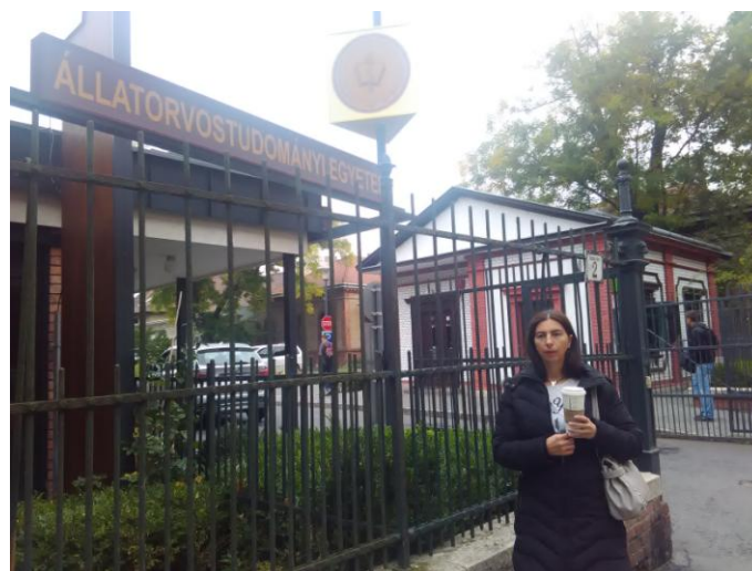
Slika 1. Univerzitet veterinarskih nauka u Budimpešti

Studijski boravak na Univerzitetu veterinarskih nauka u Budimpešti (Állatorvostudományi Egyetem, Budapest), realizovan je u period 09.10.2016. do 24.10.2016., u okviru Tempus EDUVET projekta. Primarni cilj putovanja bila je razmena iskustava i saveta u procesu izvođenja teoretske i praktične nastave iz oblasti Veterinarske radiologije, kao i stručno usavršavanje.