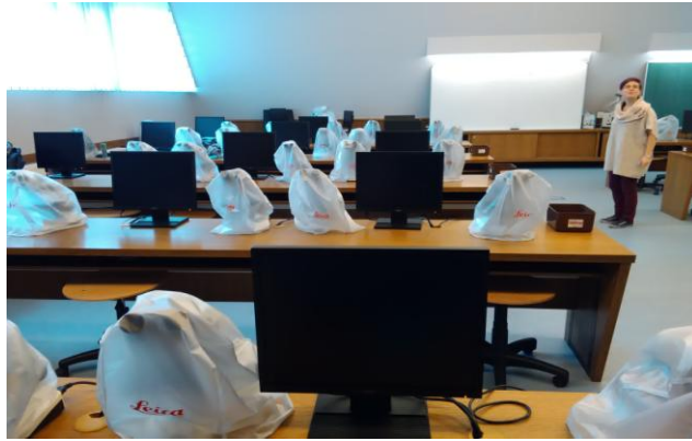
Slika 5. Sala za patohistologiju

Zaposlene na Departmanu za patologiju čini nastavno osoblje, nenastavno osoblje, tehničari i pomoćno osoblje. Šef Departmana za patologiju Ferenc Baska, a radno vreme Departmana za patologiju je od 8h do 16h.