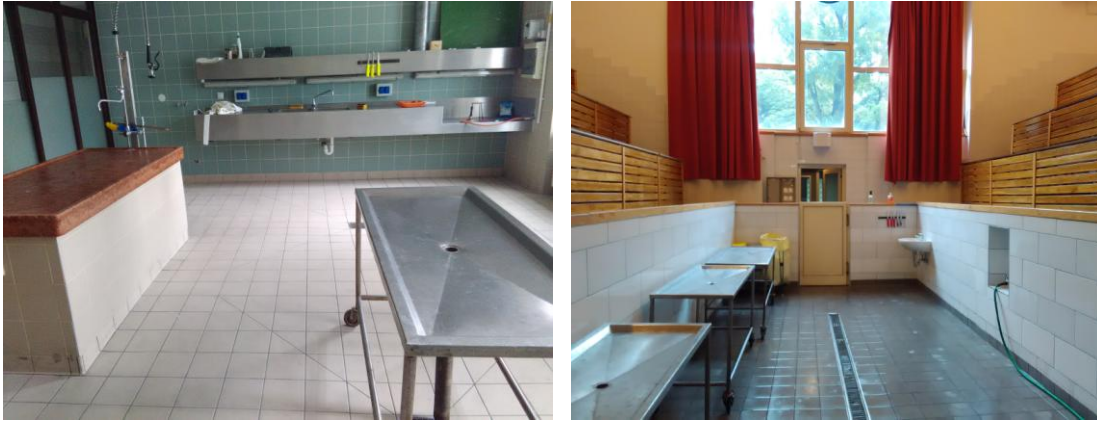
Slika 3. Sale za nekropsiju

Pre ulaska u salu za nekropsiju, studenti se presvlače u svlačionici koja je u sklopu objekta gde se nalazi sala. U svlačionici se nalaze tri prostorije: mesto za presvlačenje (20m 2 ) gde svaki student ima svoj ormarić za odlaganje garderobe, mesto za bele mantili, zaštitne nazuvice i kape za svakog studenta (15m 2 ) i toalet (10m 2 ).