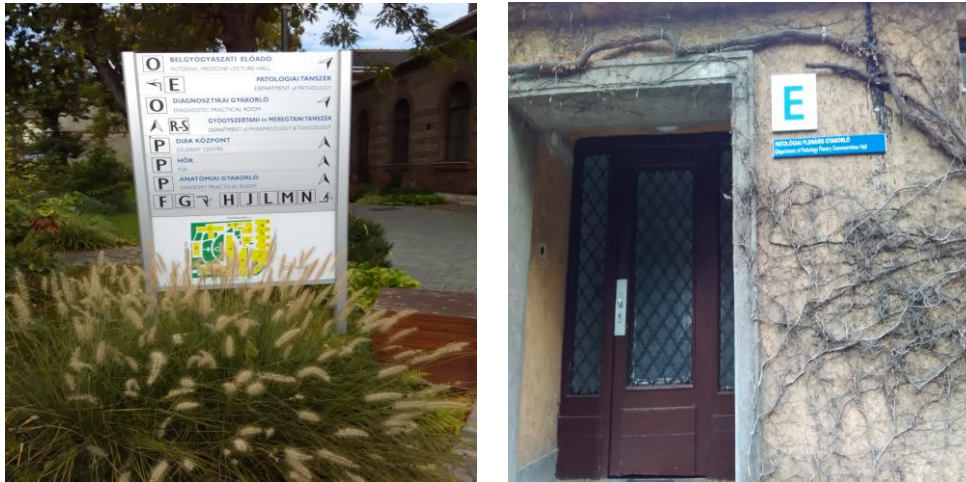
Slika 2. E blok kampusa

Za vreme trajanja posete, bila sam u mogućnosti da pratim rad Departmana za patologiju, koji se nalazi u okviru kampusa, E blok.